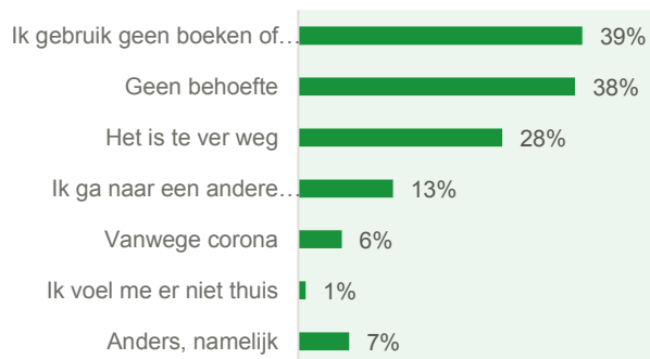
Figuur 1. Redenen van geen bezoek Centrale Bibliotheek

83% van de panelleden geeft aan de Centrale Bibliotheek wel eens te hebben bezocht. De overige panelleden hebben de bibliotheek om verschillende redenen (nog) niet bezocht (zie onderstaande figuur). De meest genoemde reden is dat men geen gebruik maakt van boeken of ander materiaal van de bibliotheek, direct gevolgd door dat men er geen behoefte aan heeft. Voor ruim een kwart van de 'niet-gebruikers' is de bibliotheek te ver weg. De voornaamste 'andere reden' om de bibliotheek niet te bezoeken is dat het er nog nooit van gekomen is. Daarnaast geven panelleden (alsnog) aan te ver weg te wonen, of boeken ergens anders vandaan te halen. Voor de volledige lijst met antwoorden wordt verwezen naar de bijlage van deze feitenkaart.