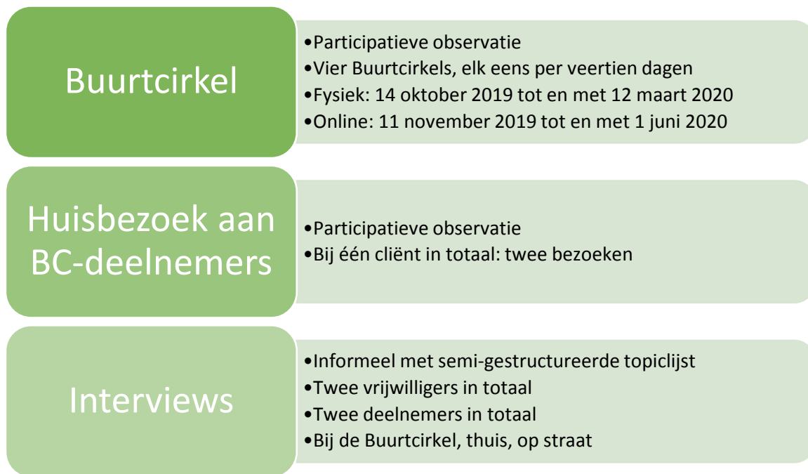
Figuur 1. De onderzoeksmethoden en activiteiten van het onderzoek.